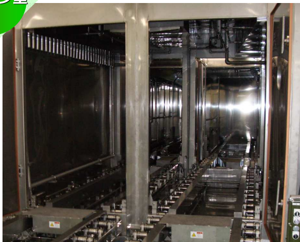
コンベア搬送方式