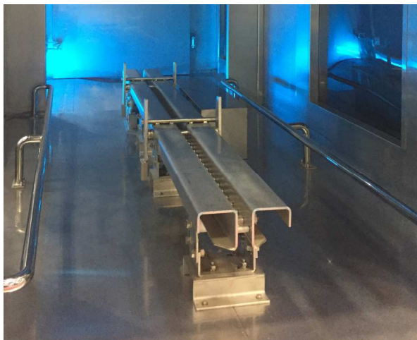
プッシュ搬送方式